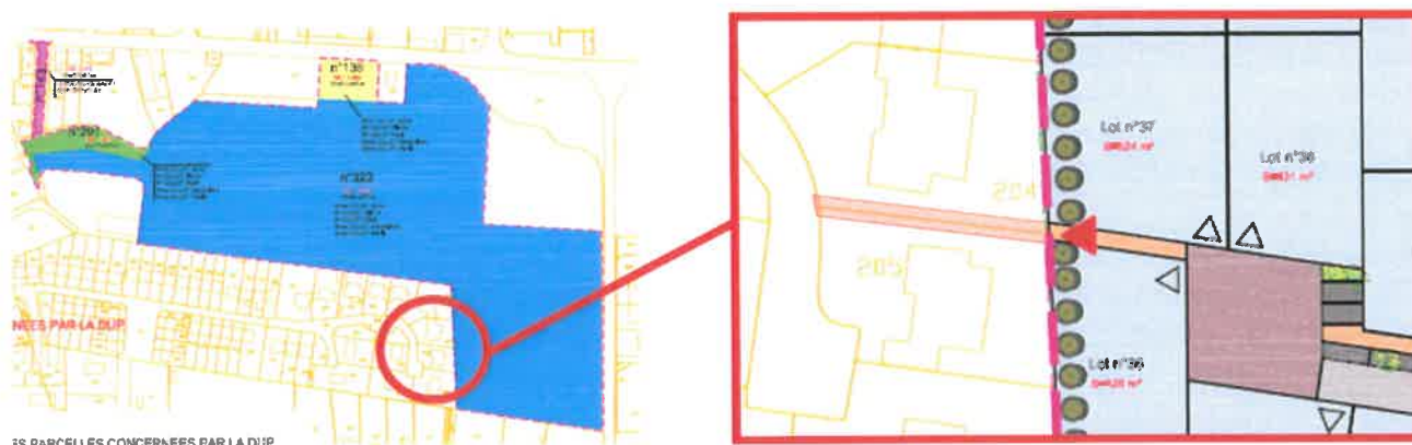
83 PARCELLES CONCERNÉES PAR LA DUP

L'un d'eux donne sur le côté de la parcelle cadastrée ZH 204, sur laquelle est située une maison individuelle.